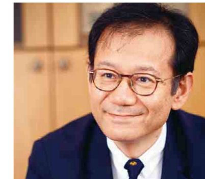
東京大学 教授/慶應義塾大学 SFC 特任教授 鈴木 寛 氏